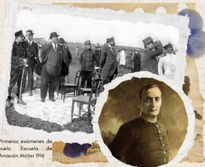
Primeros exámenes de vuelo. Escuela de Aviación Militar 1916