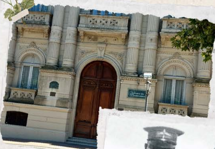
ATENEIO de Montevideo, fundado el 5 de setiembre de 1868

La gratitud de la familia Boiso con este gesto de entrega de este nuevo libro hoy se manifiesta en la entrega de sus ejemplares en instituciones como la Escuela Técnica Aeronáutica (ETA) , la Escuela de Comando y Estado Mayor Aéreo (ECEMA) , la Escuela Militar Aeronáutica (EMA) , la Base Aérea I , ubicada en el predio del Aeropuerto Internacional " Gral. Cesáreo L. Berisso " (San José de Carrasco, Canelones), la Base Aérea II "Tte. 2º Mario Walter Parallada" (Santa Bernardina, Durazno), y por supuesto el Comando General de la Fuerza Aérea (CGFA), que está dentro de la Base Aérea III "Cap. Juan Manuel Boiso Lanza" (Av. Don Pedro de Mendoza, Montevideo), que lleva con honor su nombre.