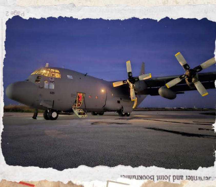
Aeronave Lockheed C-130 "Hércules", FAU 595, en el vuelo del 17 de febrero 2025 trayendo 140 ejemplares de los libros CAPITÁN JUAN MANUEL BOISO LANZA, Vida y Legado