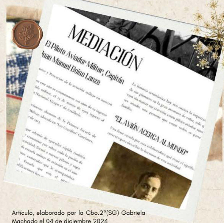
Artículo, elaborado por la Cbo.2°(SG) Gabriela Machado el 04 de diciembre 2024

Su historia vive más allá de los libros. Vive también en quienes lo recuerdan con cariño, en quienes sin haberlo conocido sienten el lazo que une su sangre a la del Capitán. Vive en el relato de quienes lo admiran.