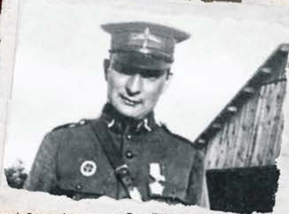
Capitán Juan Manuel Boiso Lanza, en Pau, Francia 1918.

Con esta difusión, se promueve el conocimiento, el respeto por la historia y el ejemplo de vida de un hombre que sigue volando en cada página y en cada corazón.